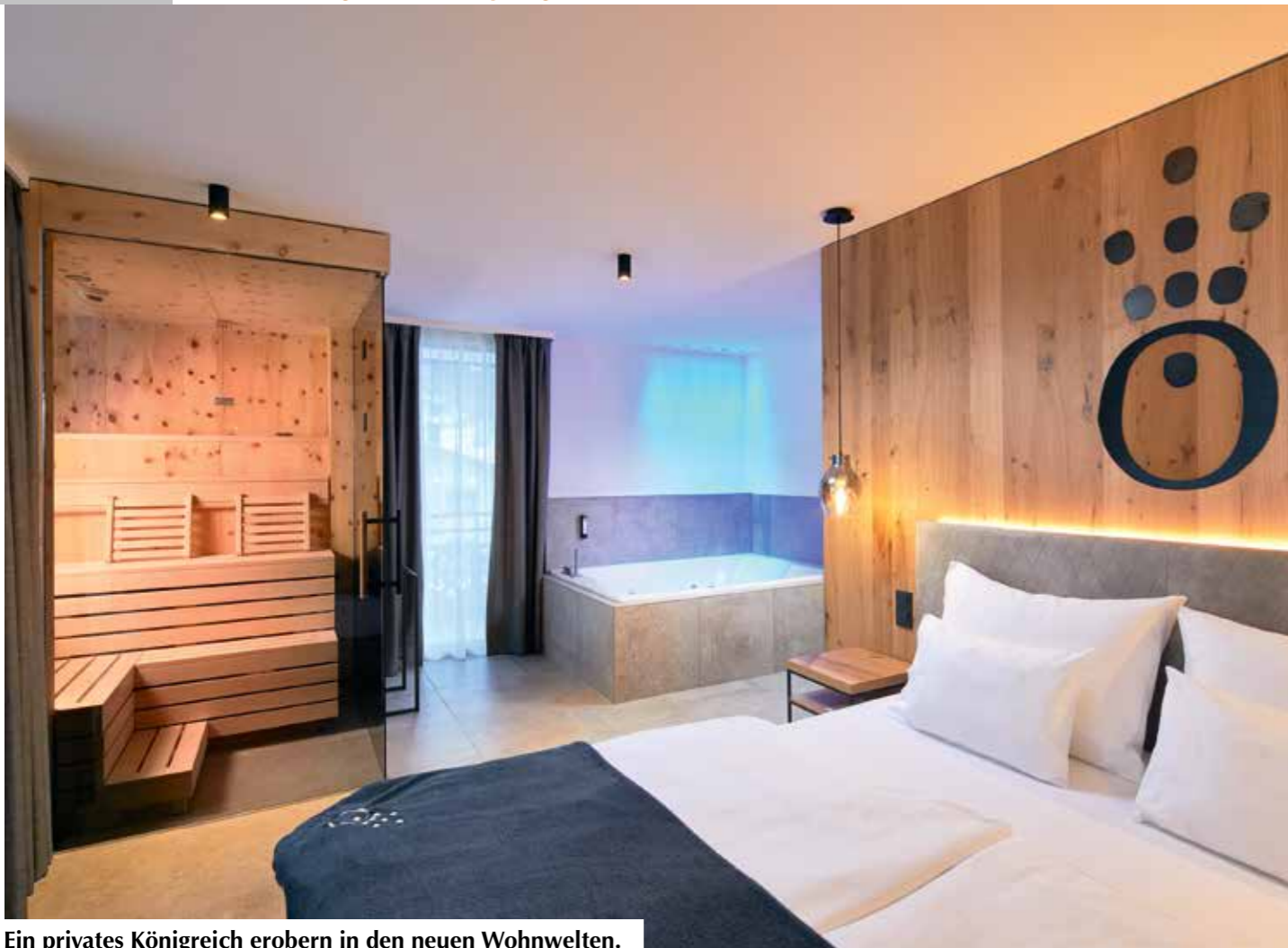
Ein privates Königreich erobern in den neuen Wohnwelten.