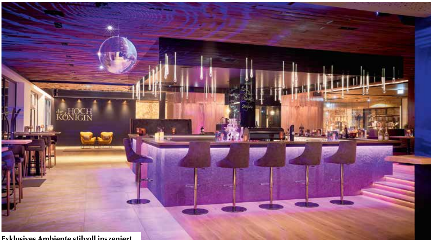
Exklusives Ambiente stilvoll inszeniert.