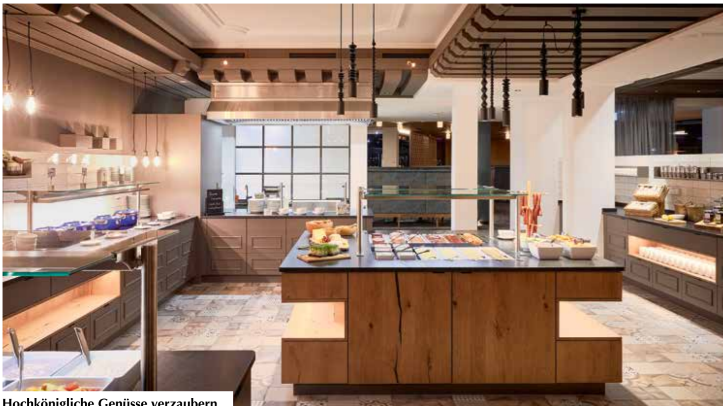
Hochkönigliche Genüsse verzaubern.