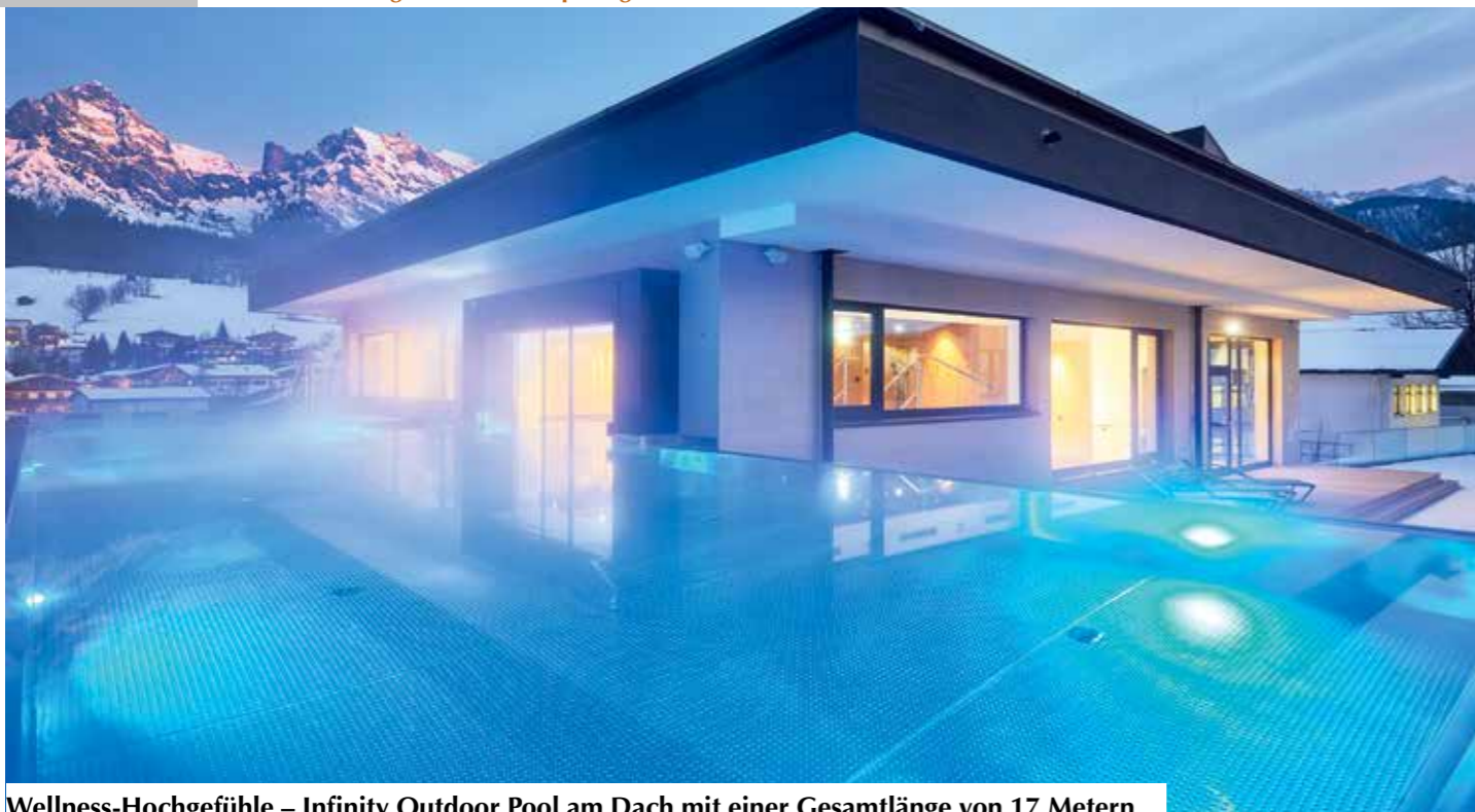
Wellness-Hochgefühle – Infinity Outdoor Pool am Dach mit einer Gesamtlänge von 17 Metern.