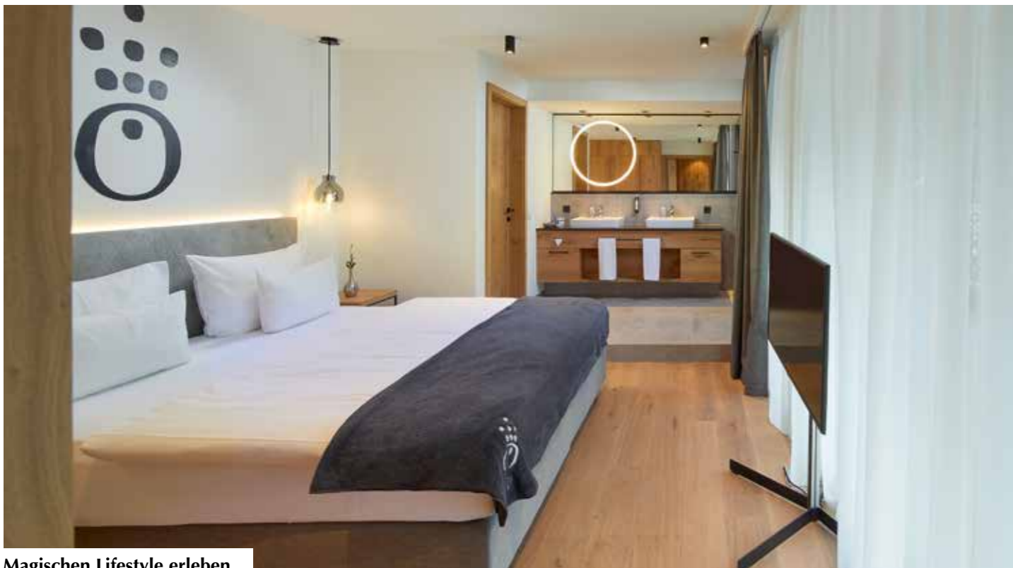
Magischen Lifestyle erleben.