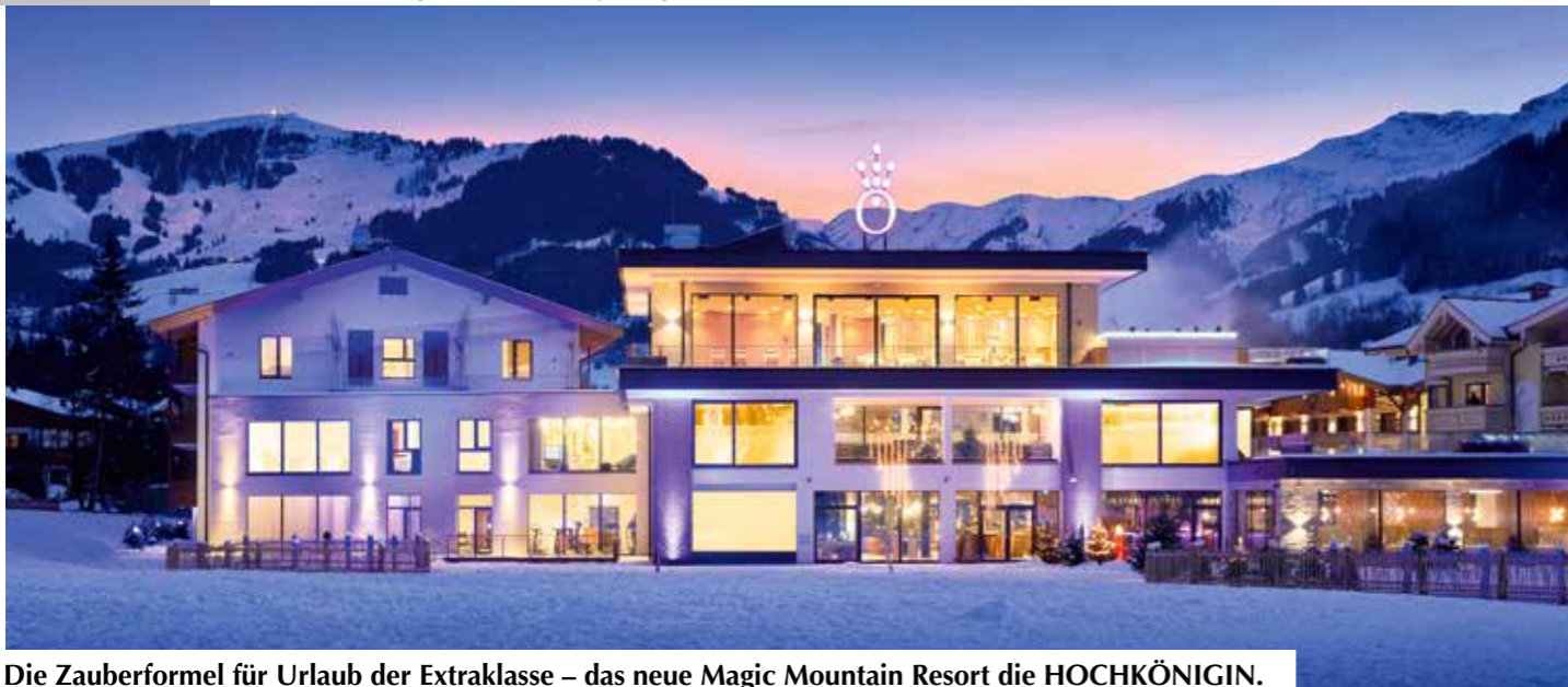
Die Zauberformel für Urlaub der Extraklasse – das neue Magic Mountain Resort die HOCHKÖNIGIN.