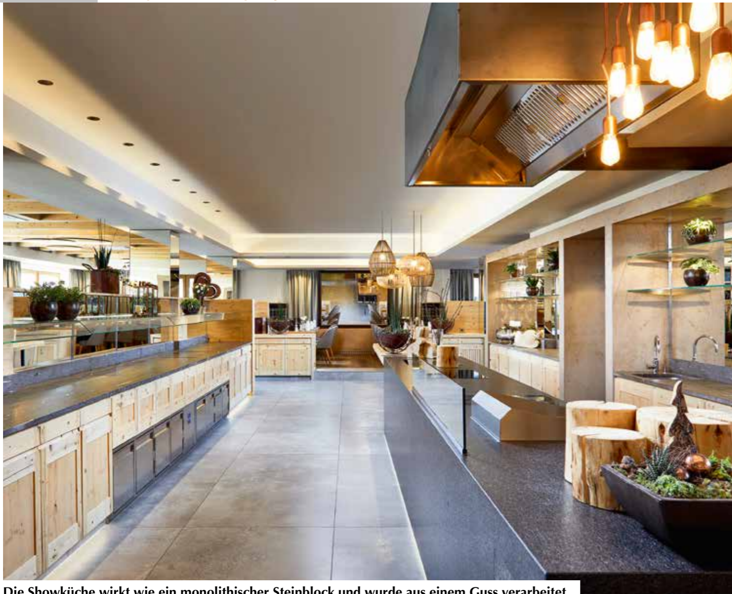
Die Showküche wirkt wie ein monolithischer Steinblock und wurde aus einem Guss verarbeitet.