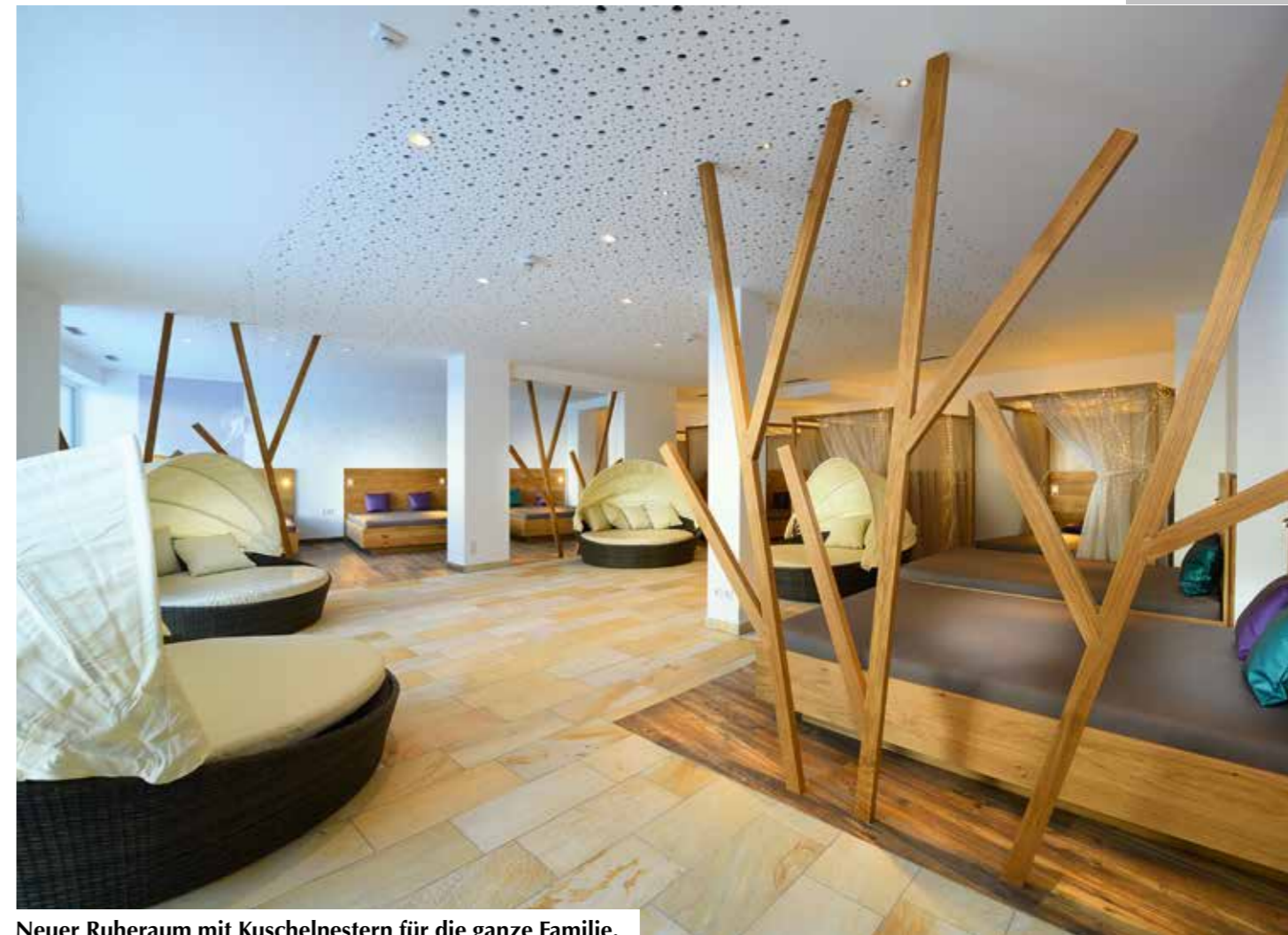
Neuer Ruheraum mit Kuschelnestern für die ganze Familie.