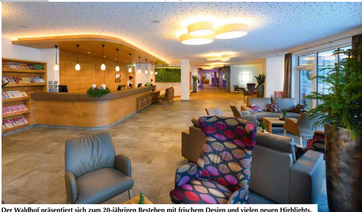
Der Waldhof präsentiert sich zum 20-jährigen Bestehen mit frischem Design und vielen neuen Highlights.