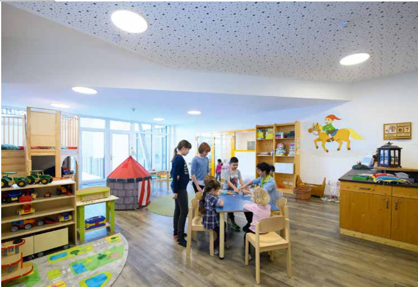
Mit diesen spannenden Neuerungen wird den Kids und Teenies bestimmt nicht langweilig – zwei getrennte Kinderclubs, Chillout Lounge und Eichhörnchengehege für kleine und große Entdecker.