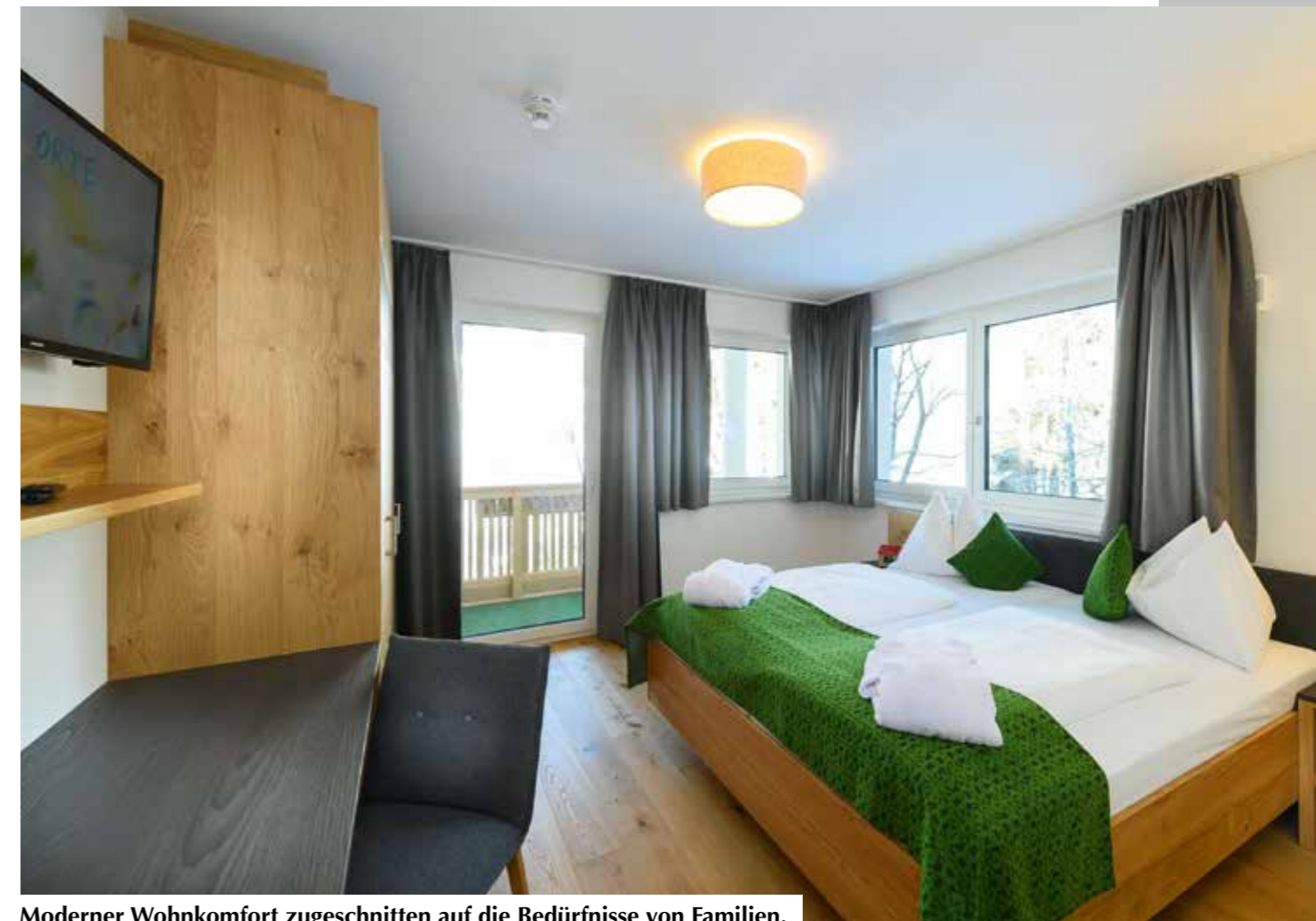
Moderner Wohnkomfort zugeschnitten auf die Bedürfnisse von Familien.

Zwei weitere Besonderheiten für Groß und Klein gleichermaßen sind die Eichhörnchenwelt und das Murmeltiergehege: Hier kann man die putzigen Gesellen beim von Ast-zu-Ast-Springen beobachten, während die Murmeltiere gerade ihren wohlverdienten Winterschlaf halten – und natürlich auch dabei beobachtet werden können.